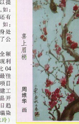
喜上眉梢 周维华画

工艺时间。与此同时,注重新产品开发研制,在常规面料生产的同时涉猎到腈纶、锦纶、多种纤维混纺的面料织造,从中吸收到比常规面料更多的营养,产品档次得以提升,尤其是各类天然绿色产品,如:粘胶类、莫代尔类、天丝类等,还有各种日趋流行的功能性加工,如:抗菌防霉处理、防虫处理、瘦身处理成为公司的亮点,从而扩大了公司的知名度。